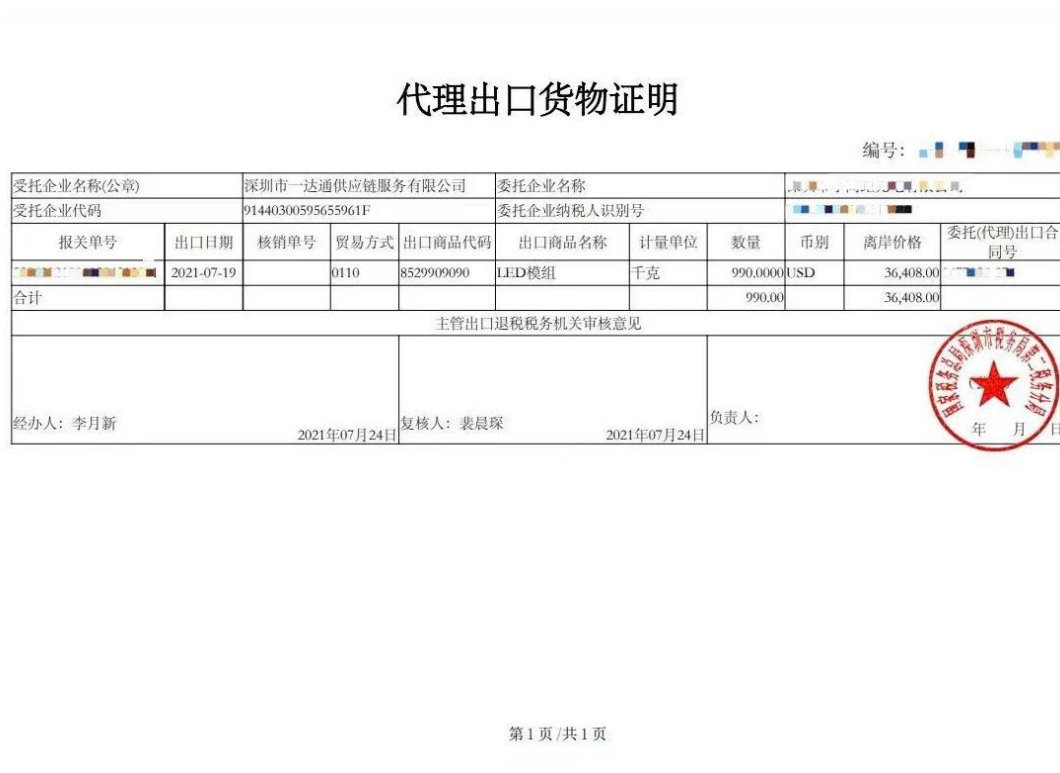
图 3: 全国首张区块链《代理出口货物证明》