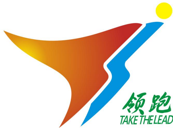
图 4：深圳出口退税“领跑”文化标志

—— 丰富青年干部培养方式，锤炼有能力有担当的人才队伍。 构建立体化人才交流培养机制。第二税务分局高度重视人才选育用管工作，印发《国家税务总局深圳市税务局出口退（免）税人才双向代岗培训工作管理办法》，与第五税务分局、国际税收管理处、各区（分）局等单位互派业务骨干进行代岗培训，定期撰写工作报告、交流心得体会，依托不同岗位的系统性锻炼强化全局视野、提升业务素养，形成培养复合型专业人才的双向合力。 深耕税收分析和理论研究。 形成专项工作“揭榜挂帅”机制，创新鼓励干部担当作为，激发干事创业成就感，为有能力、有意愿的青年干部提供研究资源和展示平台，《基于数字驱动的征退查一体化的出口退税风险防控机制研究》等课题正稳步推进，持续为出口退税现代化建设夯实理论基础。 组建出口退税专业人才队伍。 第二税务分局“党员先锋队”“团员突击队”“法律服务队”具有年轻化、素质高、能力强、能吃苦、善战斗的特点，在